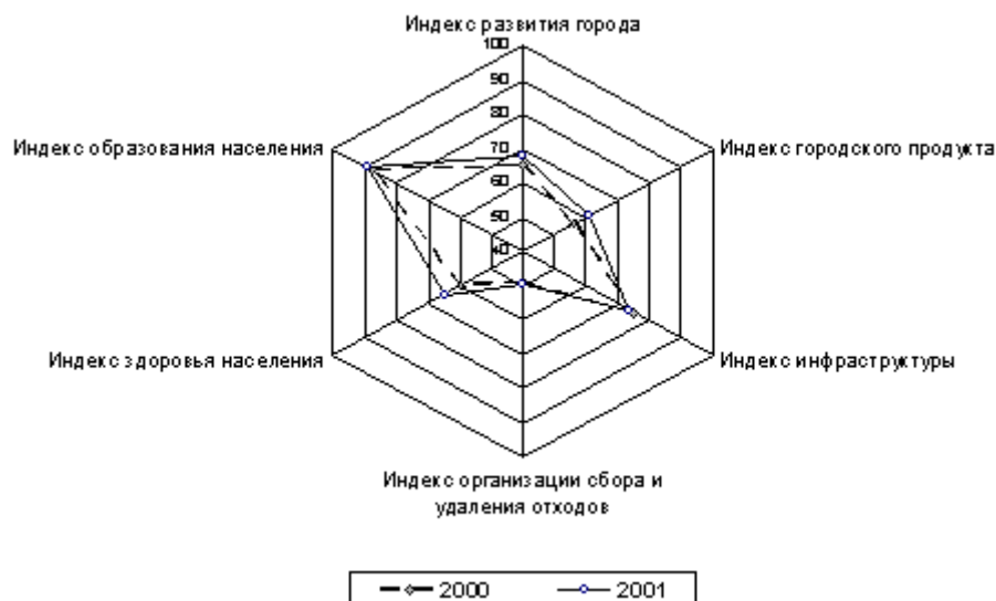
Рис. 1. Индекс развития города Тюмени

Сравнение величин индекса за два смежных года показало повышение уровня городского развития, которое сопровождалось увеличением 4-компонентных индексов, при этом их темпы отличались неравномерностью [9]. Рост наблюдался по показателям здоровья и образованности населения, что обусловлено вниманием городской власти к вопросам социальной сферы и потребностям человека, а также тем, что ситуация поддается улучшению. Умеренным темпом роста характеризовался показатель результата экономической деятельности. Слабо поддавались улучшению многофакторные индикаторы организации сбора и удаления отходов и инфраструктуры.